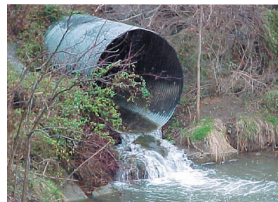
Regnvatten innehållande zink blandas ut med vatten från andra källor, vilket gör att zinkhalten sjunker ytterligare.

* Resultat från mätningar i Stockholms innerstad. Värdet har uppmätts då regnvattnet lämnar den varmförzinkade ytan. Halten sjunker sedan avsevärt pga bindning till jord och fasta ytor, samt utspädning i vattendrag.