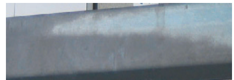
Der kan forekomme farveskifte på overfladen, men den påvirker ikke kvaliteten af korrosionsbeskyttelsen. Dette skyldes, at reaktionen mellem zink og jern sker med forskellig hastighed afhængigt af ståltypen, samt afkølingsforløbet efter forzinkningen.