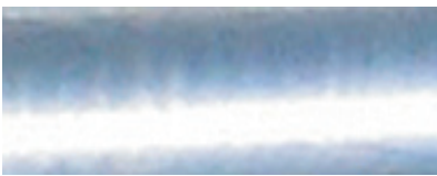
Nyforzinket gods er ofte blankt.