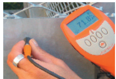
Måling af zinklagnet tykkelse.

I varmforzinkningsstandarden DS-EN ISO 1461 er det specificeret, hvordan udtagning af prøver til lagtykkelseskontrol af varmforzinket stål skal udføres. Kontrolmålingen og den øvrige kontrol gennemføres, inden godset forlader varmforzinkningsanlægget.